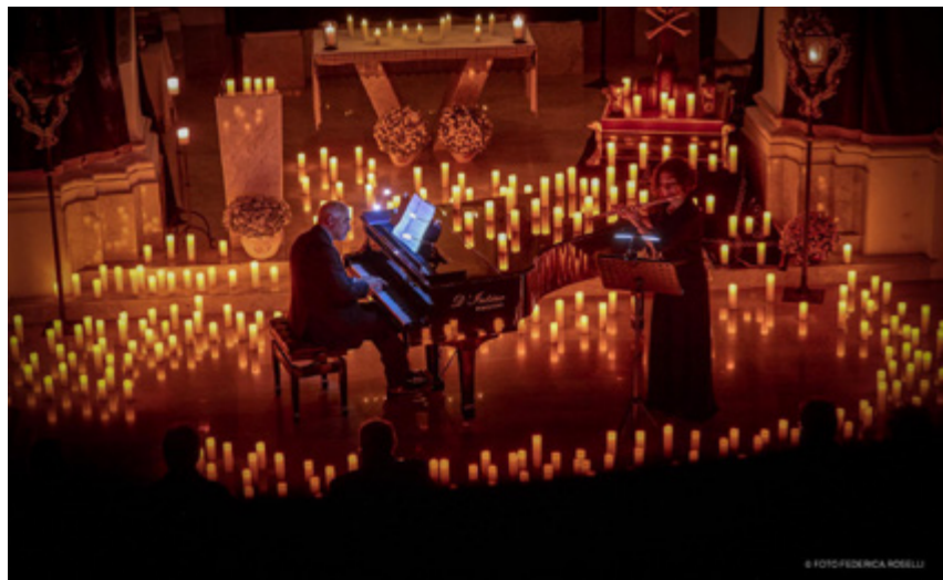
sopra Il concerto promosso dalla Confraternita Morte ed Orazione di Lanciano