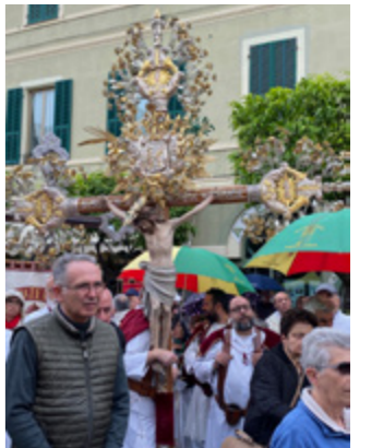
sopra Il LXV cammino regionale ligure