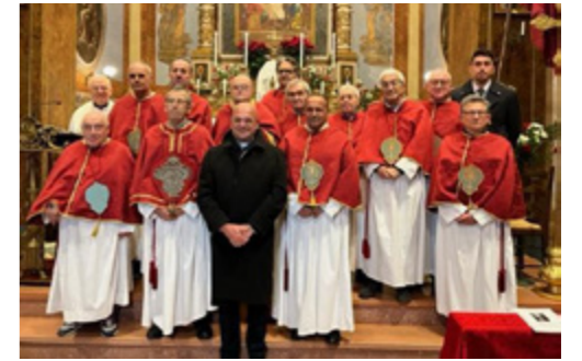
sopra I Confratelli di Civitanova Alta con l'arcivescovo Rocco Pennacchio