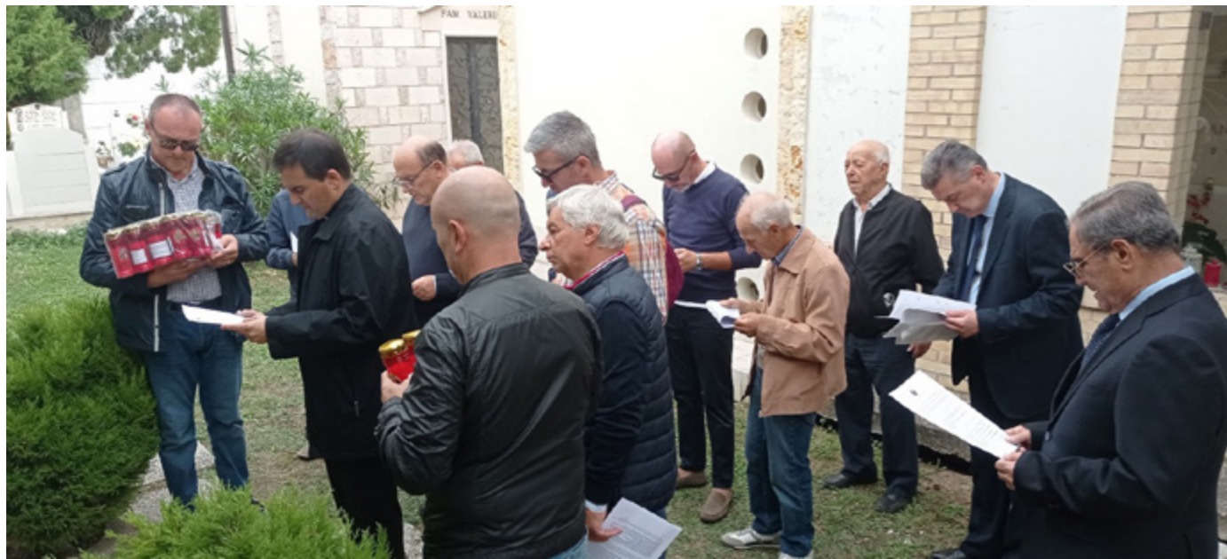
sopra I membri della Confraternita Sacra Spina di Vasto pregano per i confratelli defunti