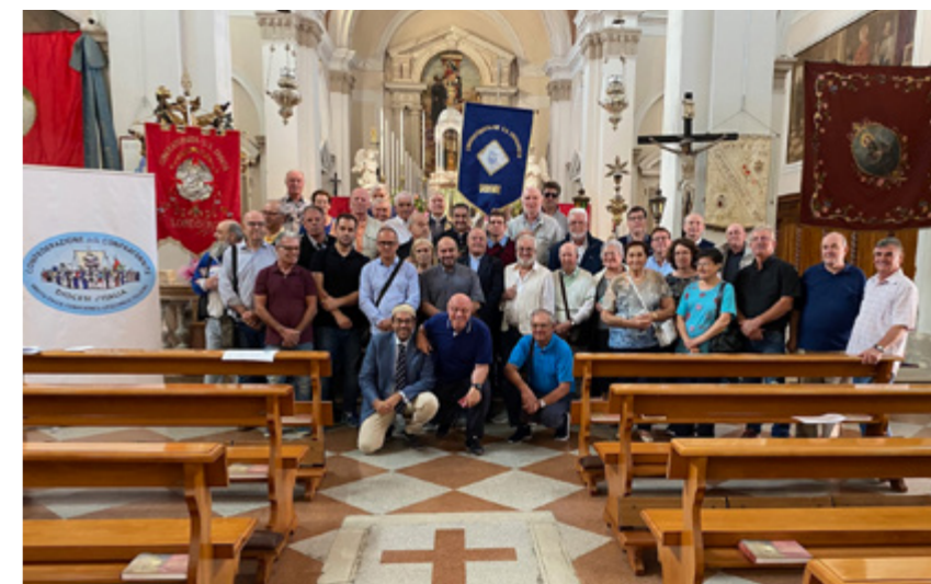
Foto ricordo del primo incontro delle Confraternite del Triveneto

*Coordinatore Confraternite del Triveneto