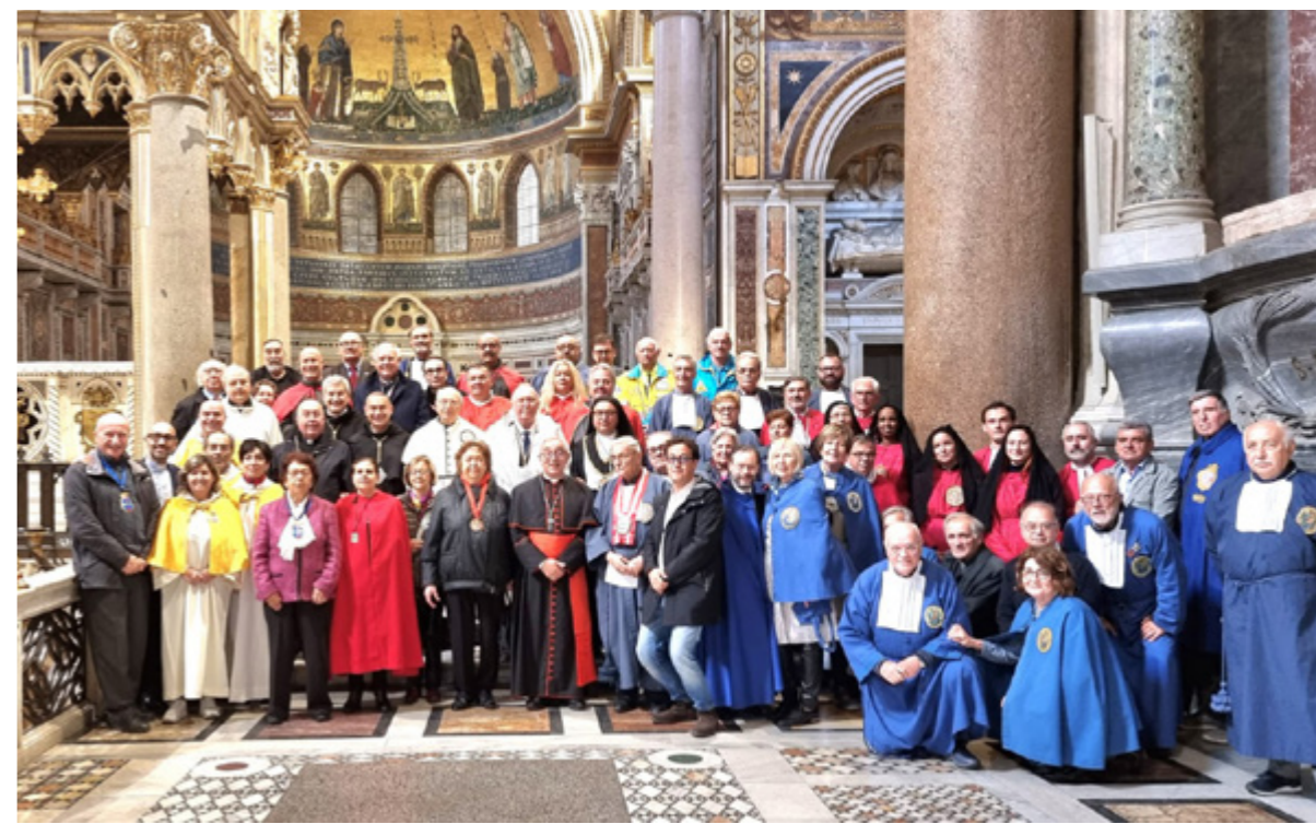
sopra Il cardinale De Donatis con le Confraternite romane

Tuttavia, se alla vigilia dell'incontro ci fosse stato ancora qualcuno convinto che le Confraternite romane di oggi fossero ormai delle istituzioni ammuffite, autoreferenziali, paludate in antiche abitudini fuori dal tempo, in tal caso i fatti hanno costituito una solenne smentita. Il cardinale De Donatis ha ascoltato con la massima attenzione e partecipazione ogni singola relazione presentata dalle davvero numerose Confraternite intervenute. In ciò si sono alternate lunghe e dettagliate esposizioni ad altre magari meno corpose, ma tutte ugualmente rivelatrici di una vitalità, di una forza e di un impegno di assoluto