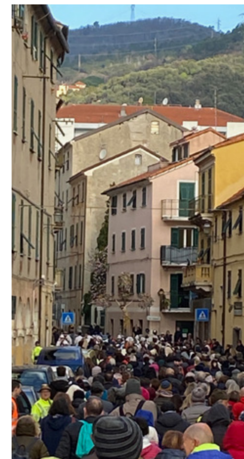
a sinistra I tanti fedeli partecipanti alla Festa a Savona