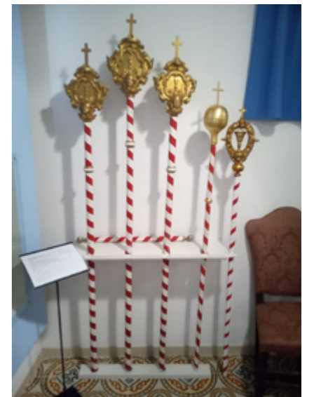
sopra "Mazze priorali" esposte nel Museo di Petriolo