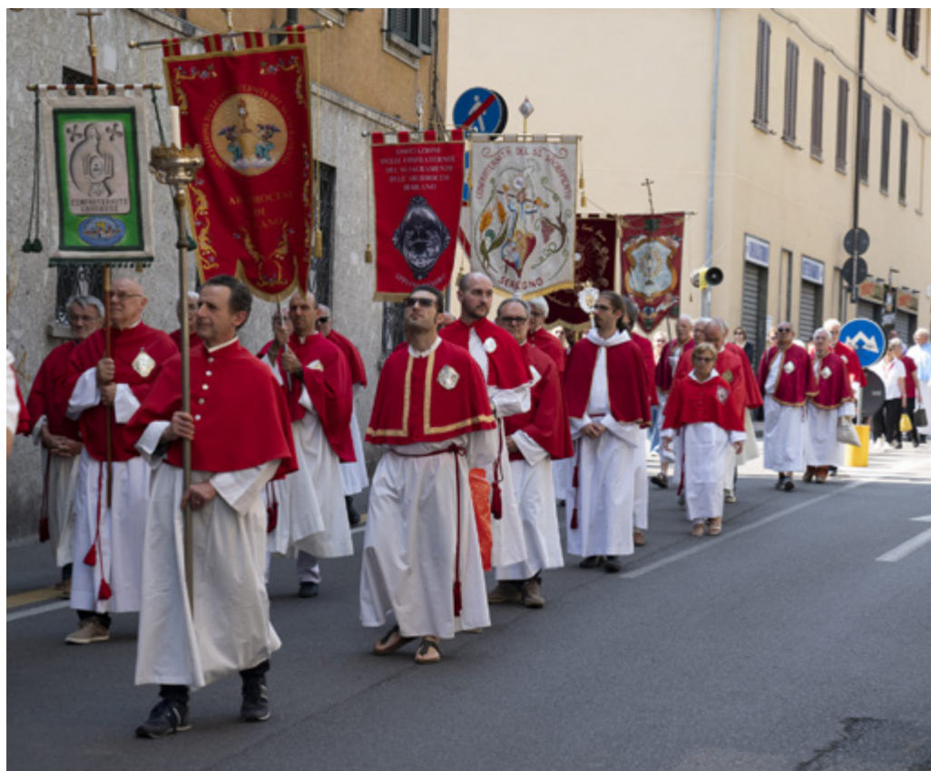
sopra Altro momento della festa a Meda