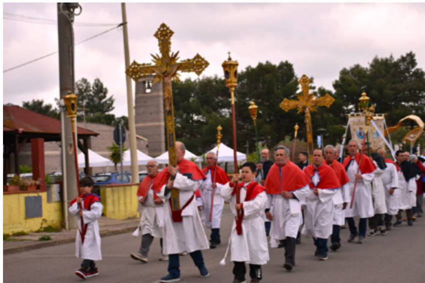
sopra Momento del Cammino diocesano a Pabillonis

chiesa della Madonna di Fatima) affollato di confratelli in camice bianco e con mozzetta/mantellina di diversi colori: rosse, nere e celesti, insieme a croci, stendardi e vessilli variopinti.