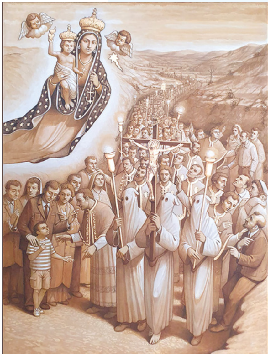
sopra L'icona del Maestro Piero Casentini

*Arturo Aiello, Vescovo di Avellino, Assistente Ecclesiastico Regionale della Campania della Confederazione delle Confraternite delle Diocesi d'Italia