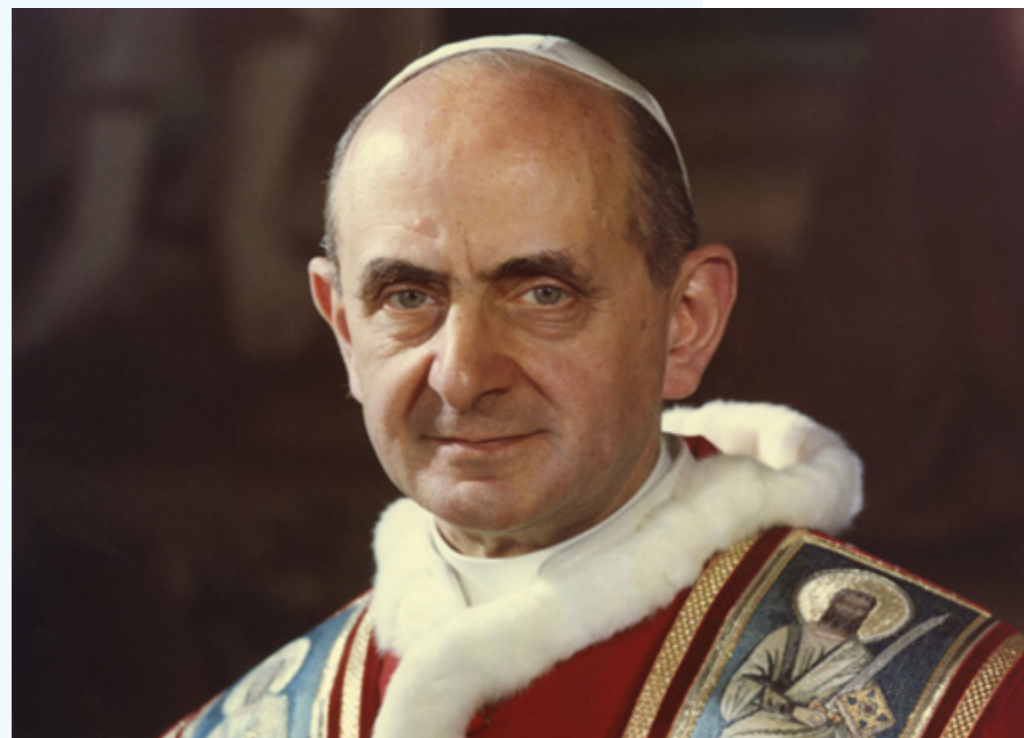
sopra San Paolo VI

in ogni regione e diocesi d’Italia”, con i loro “caratteristici abiti, che richiamano antiche tradizioni cristiane ben radicate nel Popolo di Dio” convenuti a Roma per manifestare pubblicamente la loro fede e il loro attaccamento al Successore di Pietro. Papa Ratzinger fa innanzitutto un sintetico riferimento alla storia delle confraternite sottolineando il contributo delle aggregazioni dei fedeli laici alla pietà popolare e alle opere di carità. “Come non ricordare subito l’importanza e l’influsso che le Confraternite hanno esercitato nelle comunità cristiane d’Italia sin dai primi secoli dello scorso millennio? Molte di esse, suscitate da persone ripiene di zelo, sono presto diventate aggregazioni di fedeli laici dediti a porre in luce alcuni tratti della religiosità popolare legati alla vita di Gesù Cristo, specialmente la sua passione, morte e risurrezione, alla devozione verso la Vergine Maria ed i Santi, unendo quasi sempre concrete opere di misericordia e di solidarietà. Così, fin dalle origini, le vostre Confraternite si sono distinte per le loro tipiche forme di pietà popolare, a cui venivano unite tante iniziative caritatevoli verso i poveri, i malati e i sofferenti, coinvolgendo in questa gara di generoso aiuto ai bisognosi numerosi volontari di ogni ceto sociale. Si comprende meglio questo spirito di fraterna carità se si tiene conto che esse cominciarono a sorgere durante il Medio Evo, quando ancora non esistevano