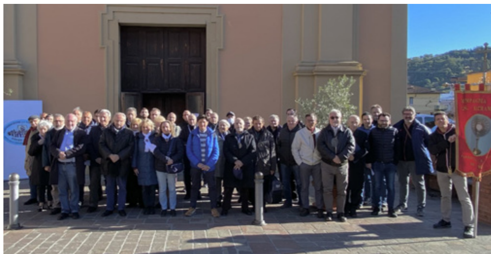
sopra I partecipanti al secondo Incontro dei rappresentanti delle Confraternite dell'Emilia Romagna

Sabato 25 novembre, presso la Parrocchia di San Ruffillo a Bologna si sono ritrovate, per l'annuale incontro, i priori e i delegati delle Confraternite dell'Emilia-Romagna.