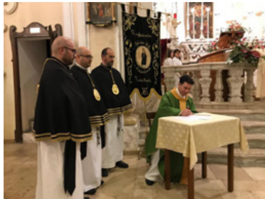
sopra La firma dell'atto di giuramento a fine Celebrazione

Si è svolta domenica 5 febbraio, nella Chiesa di San Domenico in Castellaneta, la cerimonia del giuramento di fedeltà e di insediamento del nuovo Consiglio di Amministrazione della Confraternita di Maria SS. Addolorata della Città.