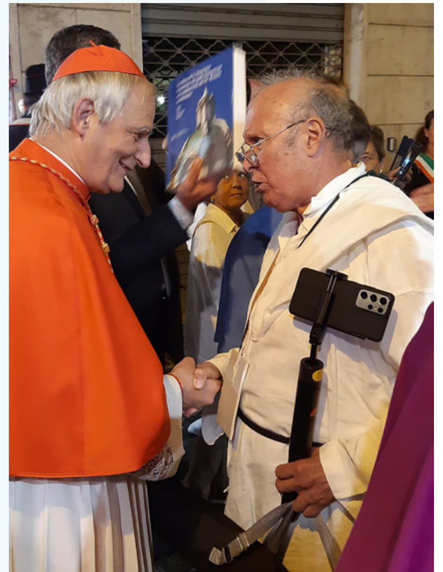
sotto Il cardinale Matteo Zuppi salutato dal Presidente Rino Bisignano

La vostra Confederazione esprime già un esempio di cammino comune e so quanto è importante proseguire in questa direzione per rinnovare un'adesione e un'appartenenza a storie che nascono da lontano e oggi si trovano ad affrontare le varie sfide del nostro tempo. Una di queste è l'impressionante velocità in cui siamo immersi e che, se non stiamo attenti, ci distrae, ci toglie tempo per la preghiera, per la meditazione e per quel silenzio tanto necessari per ascoltare la Parola di Dio e ritrovare così noi stessi. Abbiamo bisogno di fermarci, di sostare e di camminare, pellegrinando.