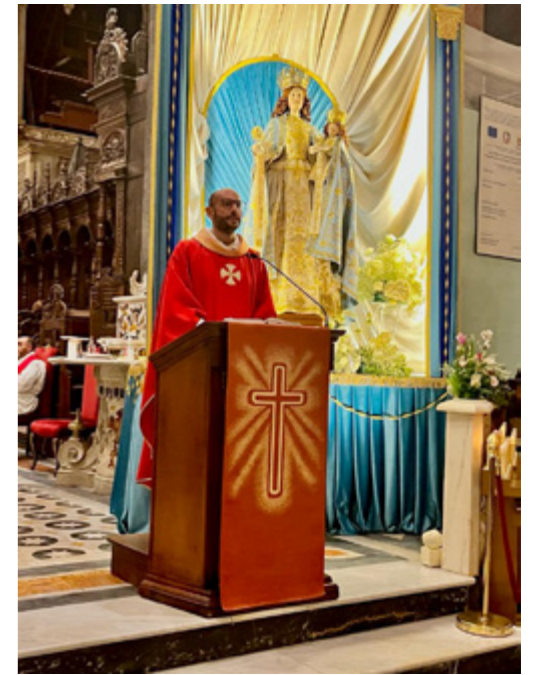
sopra Don Giovanni Giove

Le Confraternite con la loro identità sono un esempio di sinodalità. La sinodalità che non è un espediente di questo tempo ma una realtà ontologica della Chiesa che è relazione, comunione e partecipazione. E non a caso le