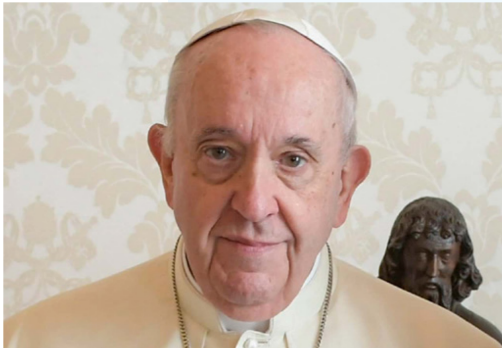
sopra Papa Francesco

Riprendendo il magistero di Giovanni Paolo II papa Benedetto insiste