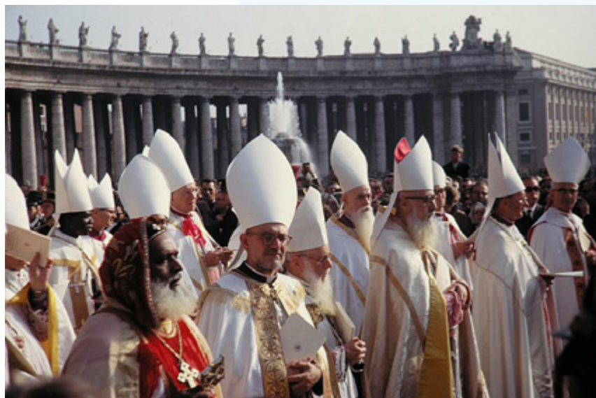
sopra Padri conciliari in piazza San Pietro

La ferita sociale prodotta dalla pandemia in questo scenario desolante, si è inasprita, molto rapidamente, la fatica degli uomini