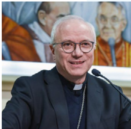
sopra L'arcivescovo Giuseppe Baturi

Buonasera a tutti, purtroppo non posso essere presente con voi a ragionare di Confraternite nella mia, nella nostra terra di Sicilia in vista del Giubileo, e della loro importanza per l'evangelizzazione di questo nostro mondo.