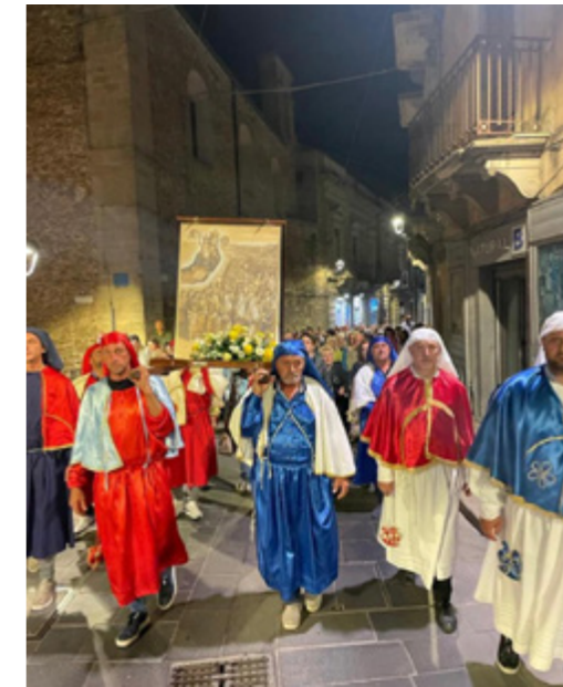
*Arciconfraternita SS.mo Crocifisso in San Pietro, Acireale