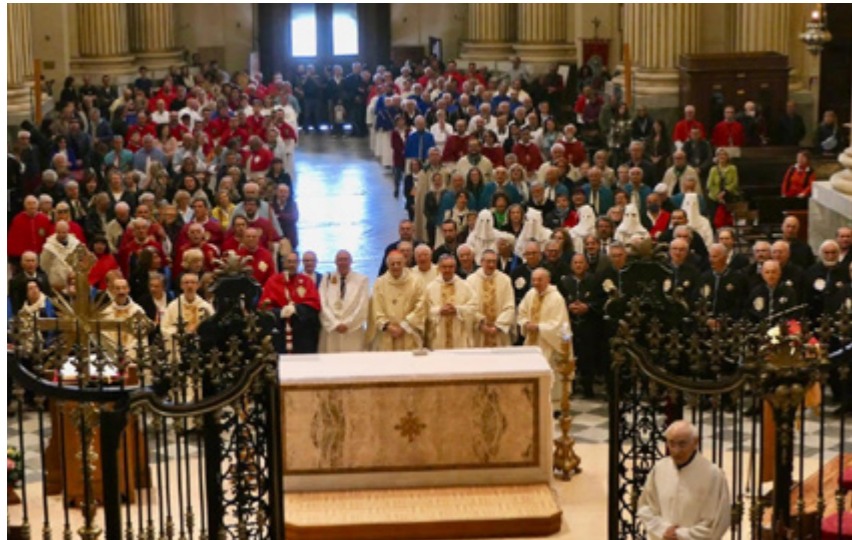
sopra Foto di gruppo del pellegrinaggio con il cardinale Zuppi

Arrivò a Roma nei primi anni Sessanta e divenne insegnante di religione presso il Liceo A. Righi, l'istituto L. Pareto, Il Q. Sella e il Marymount. Con i suoi giovani fondò la sua prima comunità di preghiera nel 1968 presso le suore di S. Francesca Cabrini in via Sicilia. Mentre prestava il Suo servizio quale Archivistista presso la