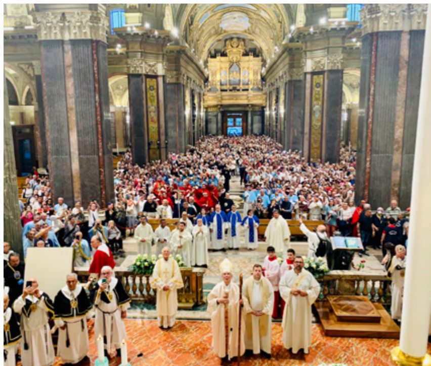
sopra La celebrazione guidata da monsignor Pennisi a Pompei

L'icona proseguirà il suo cammino nei mesi successivi tra le confraternite delle diocesi d'Italia, fino a giungere a maggio 2025 in Piazza S. Pietro in Roma, in occasione del Giubileo delle confraternite, con l'intento di presentarla al Santo Padre Papa Francesco con il suo carico di preghiere e gesti di carità.