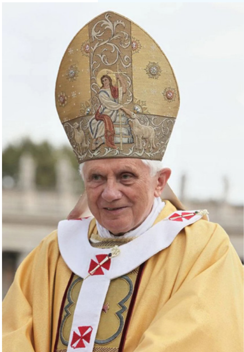
sopra Benedetto XVI

in ogni regione e diocesi d’Italia”, con i loro “caratteristici abiti, che richiamano antiche tradizioni cristiane ben radicate nel Popolo di Dio” convenuti a Roma per manifestare pubblicamente la loro fede e il loro attaccamento al Successore di Pietro. Papa Ratzinger fa innanzitutto un sintetico riferimento alla storia delle confraternite sottolineando il contributo delle aggregazioni dei fedeli laici alla pietà popolare e alle opere di carità. “Come non ricordare subito l’importanza e l’influsso che le Confraternite hanno esercitato nelle comunità cristiane d’Italia sin dai primi secoli dello scorso millennio? Molte di esse, suscitate da persone ripiene di zelo, sono presto diventate aggregazioni di fedeli laici dediti a porre in luce alcuni tratti della religiosità popolare legati alla vita di Gesù Cristo, specialmente la sua passione, morte e risurrezione, alla devozione verso la Vergine Maria ed i Santi, unendo quasi sempre concrete opere di misericordia e di solidarietà. Così, fin dalle origini, le vostre Confraternite si sono distinte per le loro tipiche forme di pietà popolare, a cui venivano unite tante iniziative caritatevoli verso i poveri, i malati e i sofferenti, coinvolgendo in questa gara di generoso aiuto ai bisognosi numerosi volontari di ogni ceto sociale. Si comprende meglio questo spirito di fraterna carità se si tiene conto che esse cominciarono a sorgere durante il Medio Evo, quando ancora non esistevano