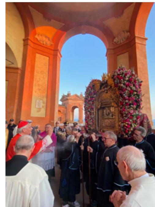
sopra Il cardinale Zuppi venera l'Icona della BV di San Luca

*Coordinatore Confraternite Emilia-Romagna